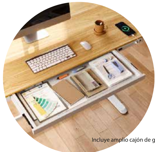
Incluye amplio cajón de guardado